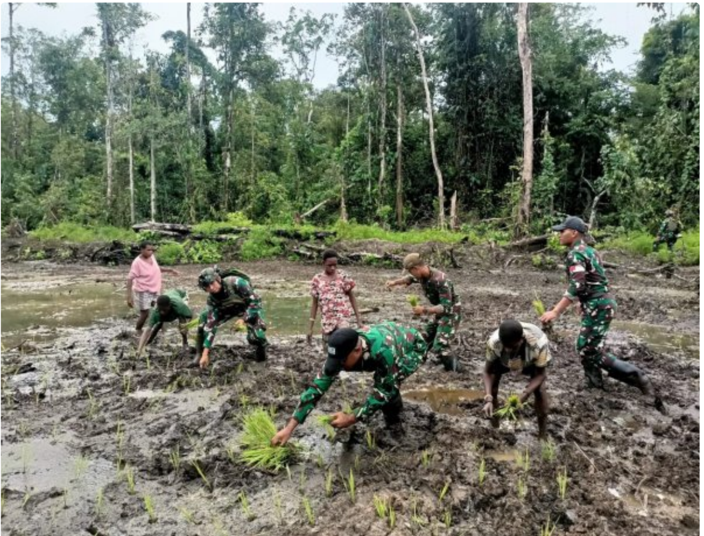
Foto: Satgas Pamtas Mobile RI-PNG Yonif 503/Mayangkara menggagas program ketahanan pangan yang melibatkan langsung warga Kampung Mumugu, Distrik Krepkuri, Kabupaten Nduga, Selasa (07/01/2025).