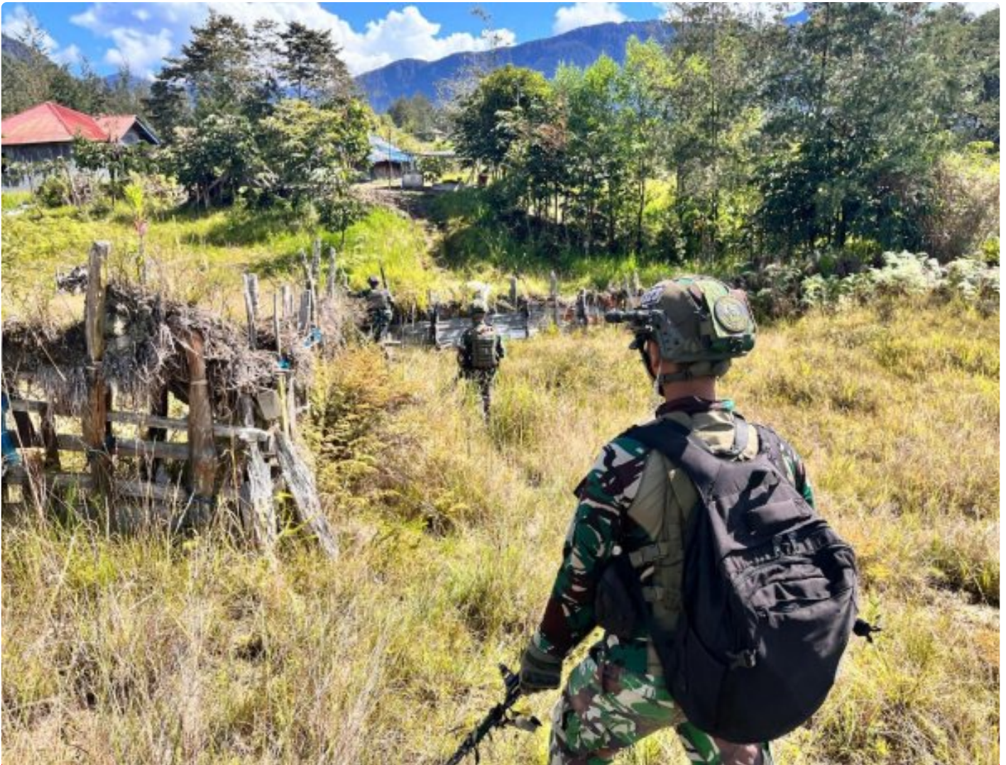
Satgas Mobile Yonif 323 Buaya Putih melaksanakan Patroli Komsos

Satgas Yonif 323 Buaya Putih Kostrad pada saat melaksanakan patroli menjaga keamanan di sektor wilayah tanggungjawabnya di wilayah kampung Gigobak,